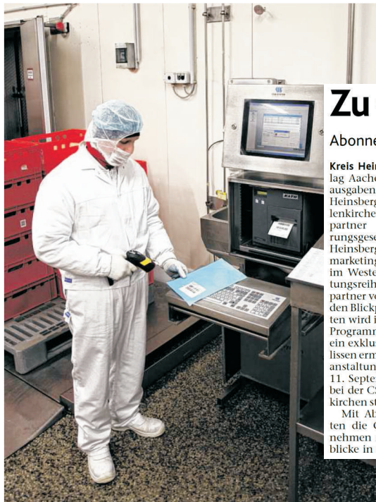
Ohrmarkengenau: Rindfleisch-Artikel lassen sich dank CSB Traceability von der Verkaufsverpackung bis zum Bauern zurückverfolgen. Fleischverarbeiter Vion Convenience nutzt die Technologie aus Geilenkirchen.

Traceability – die Rückverfolgbarkeit – ist aktuell ein „Topthema“ bei CSB-System und seinen Kunden. In Zeiten von schlagzeilen-trächtigen Lebensmittelskandalen und gestiegenem Verbraucherbewusstsein ist es in zunehmendem Maße von Bedeutung, dass jederzeit rasch und einfach festgestellt werden kann, wann und wo und