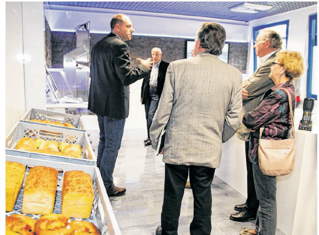
Zu Gast bei der CSB-System AG in Geilenkirchen: Bei dem Rundgang durch das Unternehmen stand der Showroom (Foto) ebenso auf dem Programm wie das Rechenzentrum.

„Redundanz“ ein Schlüsselwort. Alle Systeme seien sicherheitshalber doppelt vorhanden. Aber nicht nur das, denn abgesichert ist dieses Rechenzentrum in jeder Hinsicht: nicht nur gegen eventuelle Eindringlinge oder Angriffe von Hackern und (mit einer Argon-Löschanlage) gegen Brandgefahren. Sollte der Strom ausfallen, springt nach zehn Sekunden ein 800 PS starkes, mit Diesel betriebenes Notstromaggregat an. Die kurze Zeit bis dahin ist auch zu überbrücken: dank permanentem Einsatz von Batterien. Und wenn die Glasfaserleitung der Telekom einmal gestört sein sollte, wird die Datenverbindung von CSB-System ins weltweite Netz blitzschnell über eine Richtfunkstrecke zum Erkelenzer Fernmeldeturm aufgebaut.