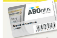
Vorteilsangebote exklusiv für Abonnenten

herstellers zu gewinnen. Nehmen Sie teil an einer exklusiven Veranstaltung. Die Teilnehmerzahl ist begrenzt. Die genaue Uhrzeit und der Treffpunkt werden den ausgelosten Teilnehmern schriftlich mitgeteilt.